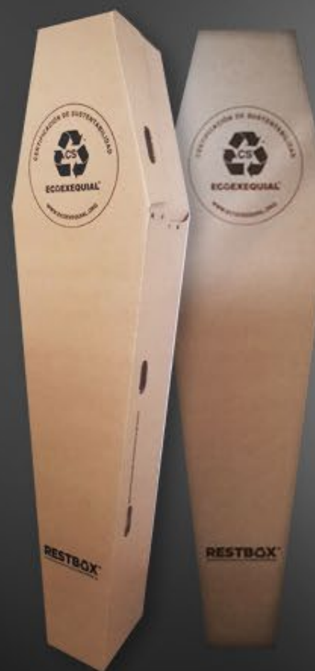
MECOX™ Cremaciones Directas