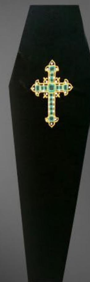
MECOX™ Traslados Externos