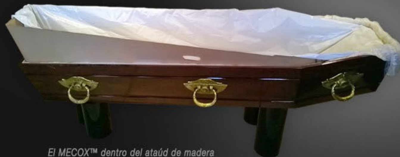
El MECOX™ dentro del ataúd de madera